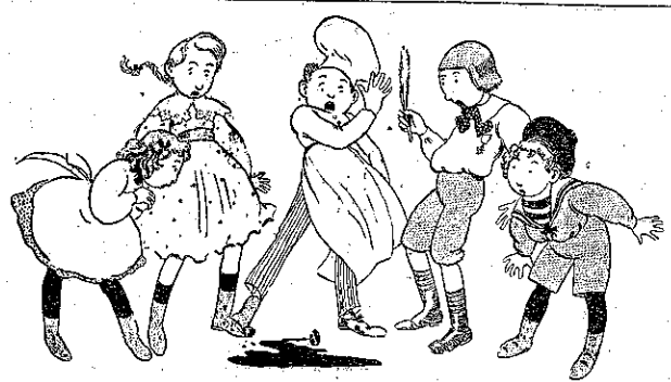
"Ὅλο τὸ μελάνι ἐχόθη! (Σελ. 165, στ. α')