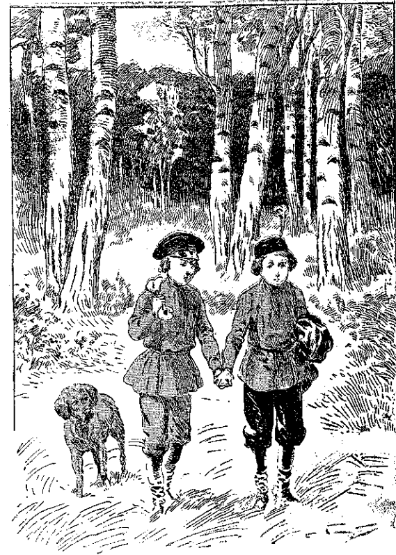
"Ἦσαν καὶ οἱ δύο συγκεκμημένοι... (Σελ. 166, στ. α')

Ἡ Μελανία ἔβυσε ξυλοράκια, τὰ ὅποια θὰ ἐχρησίμευαν ὡς πηροῦνια διὰ τὸ κρέας. Καθένας εἶχε πάρῃ μαζὶ τοῦ τὸ κουτάλι του. Ὁρεκτικῆ εὐωδία ἐσκορπίζετο εἰς τὸν ἀέρα καὶ ὁ Βάσκας μετὰ δυσκολίας ἐκρατεῖτο... Ἄλλα